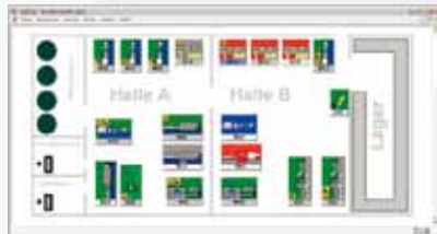
Kontroll centrum: hall layout