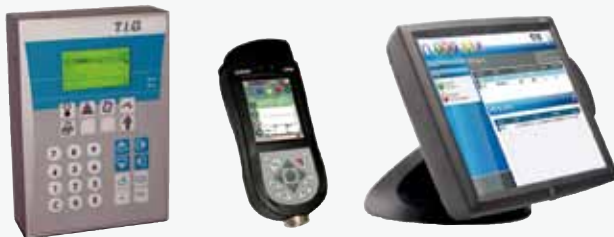
Kleine grafische terminal, PDA, Touch terminal