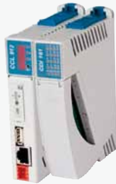
CPU voor ontvangst van machine data