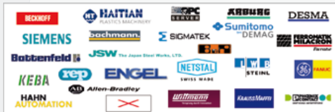
Voorbeelden van gerealiseerde interfaces